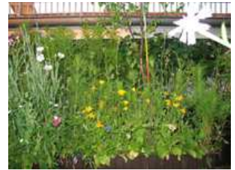
Kosmea und Kresse

Es fiel mir auch auf, dass die an der Ostseite immer stark wuchernde Morning Glory - eine stark, besonders am frühen Morgen, blühende Wicke - recht kümmerlich dahinvegetierte.