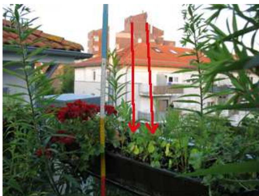
Kosmea und Kresse wurden nur 15 bis 20 cm hoch, im Hintergrund GSM- Antennen; der Blumenkasten wird direkt angestrahlt; (rote Pfeile)