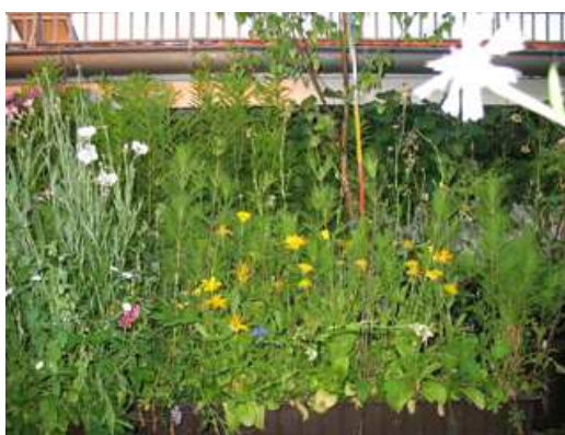
Kosmea und Kresse im Hintergrund nicht direkt angestrahlt; 60 bis 70 cm hoch.

Auffällig ist hier die Zunahme der Strahlung im Bereich zwischen 3 bis 6 GHz, welche im ersten (verdeckten) Durchgang nicht nachweisbar war.