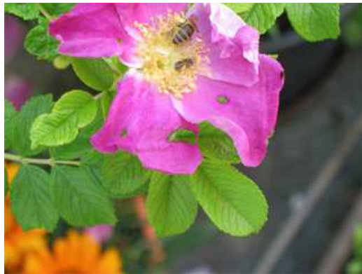
Normale Biene und „Minibiene“ zum Vergleich (kein „Sichtkontakt“)

Der unterschiedliche Wuchs bei Pflanzen (siehe oben) lässt sicherlich ähnliche Schlussfolgerungen zu.